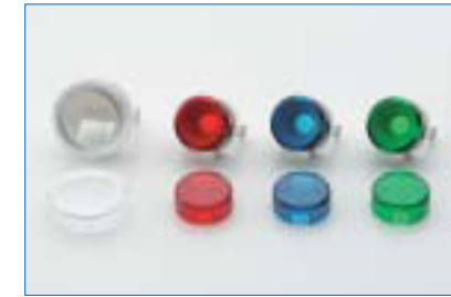
アミューズメント関連精密成形品