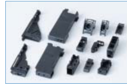
センサー関連精密成形品