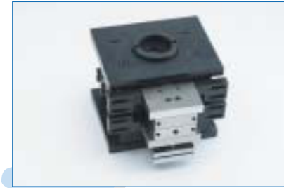
Mold Station System