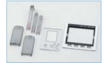
外装部品、印刷加工部品