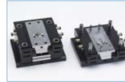
Mold Station System